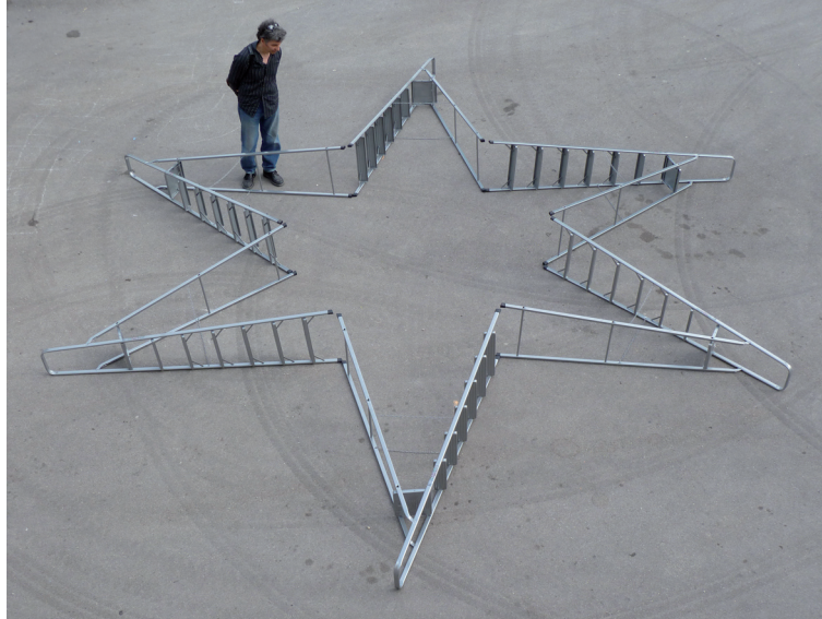
Deneb du Cygne , 2010, 6 escabeaux aluminium Festival Ap'art, Saint-Rémy de Provence, juillet 2010