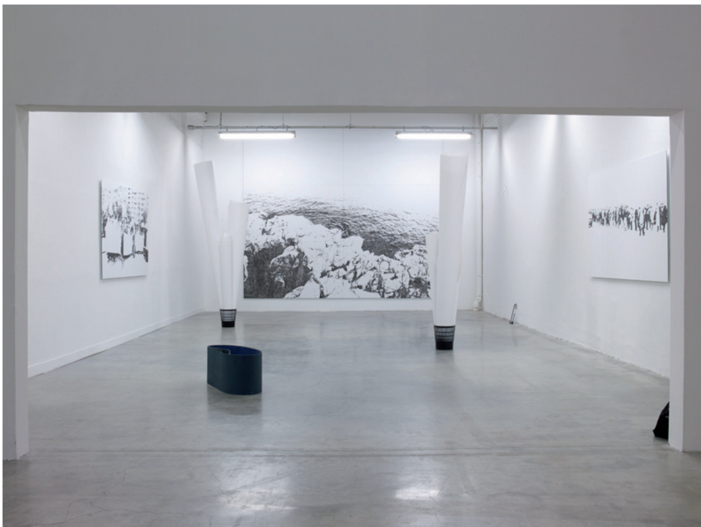
Vue de l'exposition Mes plans sur la comète , mars 2010, Palais de Tokyo, Paris.