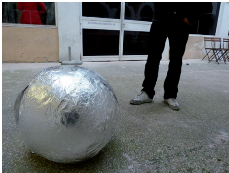
Décisif , 2010, film aluminium, diamètre 80 cm. Performance au FRAC PACA, septembre 2010